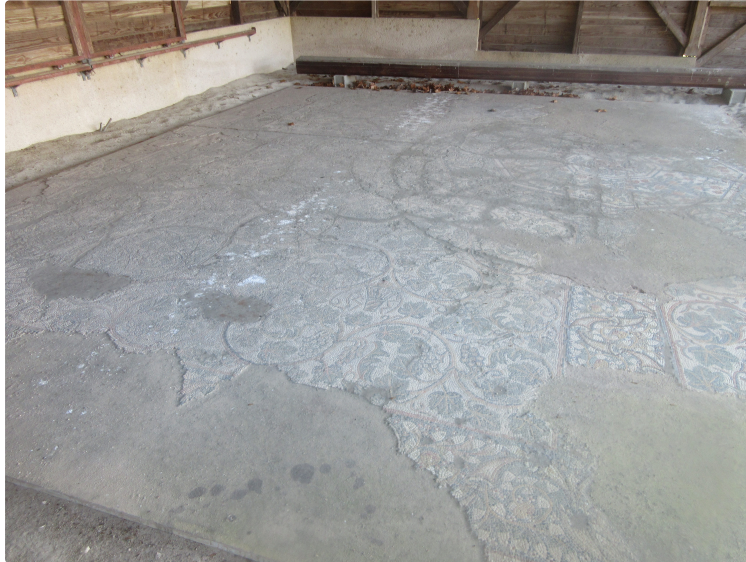
Un patrimoine en danger

La mosaïque à décor de pampres de Valence-sur-Baïse (Gers) a été découverte, entre les lieux-dits Le Miam et La Grange du Mian, dans un champ qui porte le toponyme de Gleiza, à l'extrémité occidentale du territoire communal, près des limites avec les communes de Mansencôme, Mouchan et Lagardère. Elle ornait une villa rurale qui occupait un léger mamelon (altitude 150 mètres) ; abrité du vent du nord par le plateau du Miam (altitude 19 mètres), il descend en pente douce en direction du sud et de l'est, vers la petite vallée du ruisseau de Grézillon.