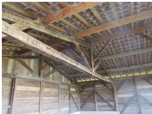
Laffargue bis-min (1).JPG

L'illustration, ci-dessus, est le plan de situation de la Grange et de la mosaïque du Mian.