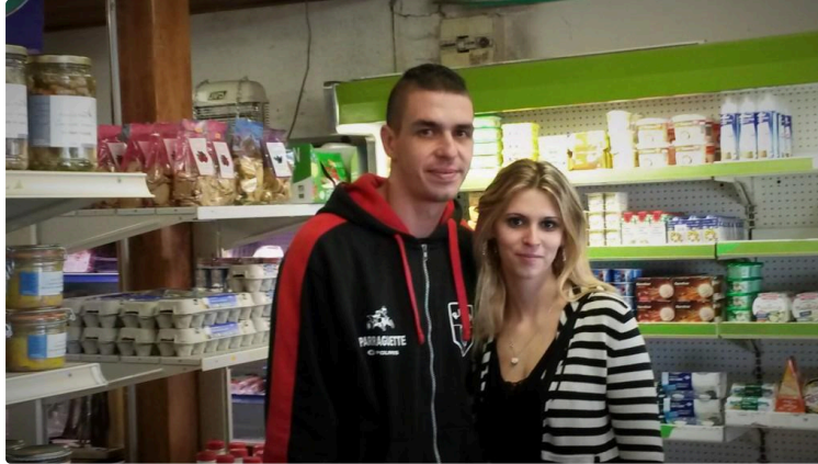
Une nouvelle page s'ouvre au magasin Proxi

C'est une excellente nouvelle, comme aimeraient en avoir la plupart des villages qui voient leurs commerces de proximité fermer peu à peu leurs portes, faute de repreneurs.