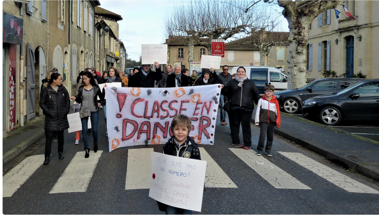
non à la fermeture de classe !

parents d'élèves et municipalité manifestent.