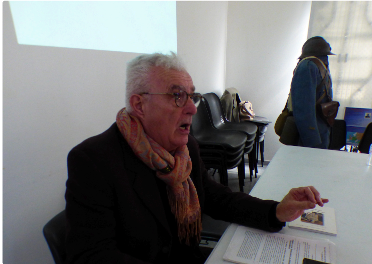
Les poilus de la Grande Guerre