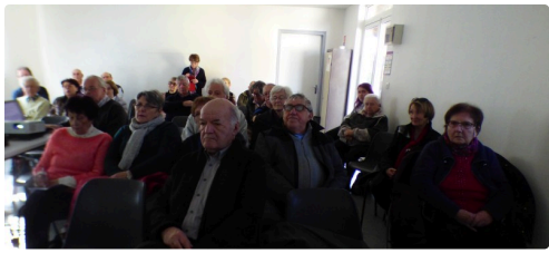
Une belle assistance