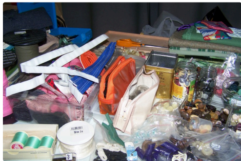
Boutons, fils, rubans, dentelles, des éléments pratiques pour la trousse à couture

Il est vrai que l'hiver n'est pas encore terminé, la couture reste un passe temps « cocooning » des plus agréables, au coin du feu les petites mains s'activent, robes, déco ou tricot, l'important est de se distraire tout en créant.