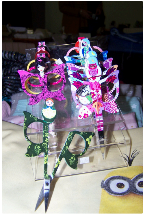
Pour le côté original, ces minis ciseaux aux formes de hibou, ourson, poupée russe et personnages divers