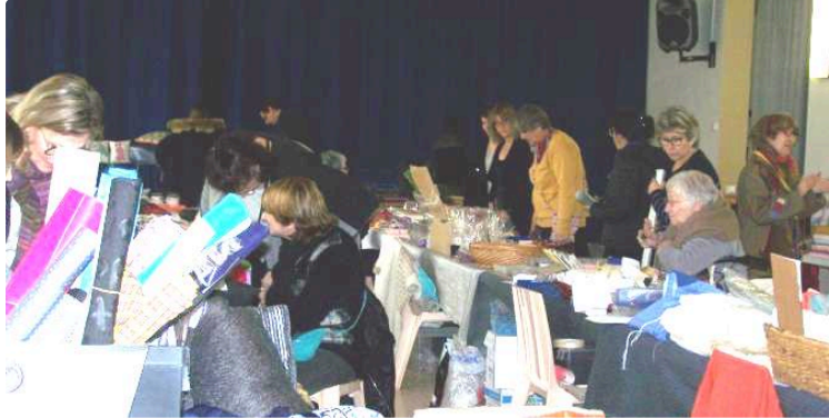
Les Puces des couturières pour la 4ème année

Photo : Un vaste choix pour les petites mains