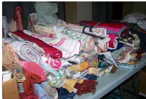
Tissus unis ou bariolés