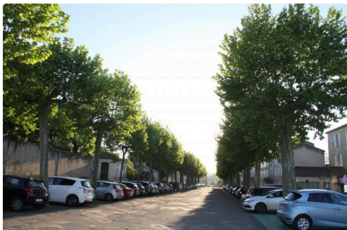
IMG_8835 Promenade Condom.jpg