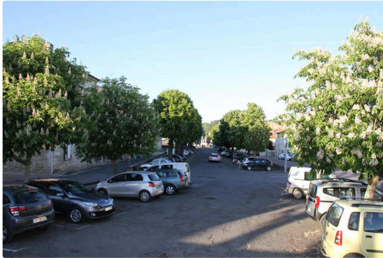
Deux réunions pour parler du projet des Promenades