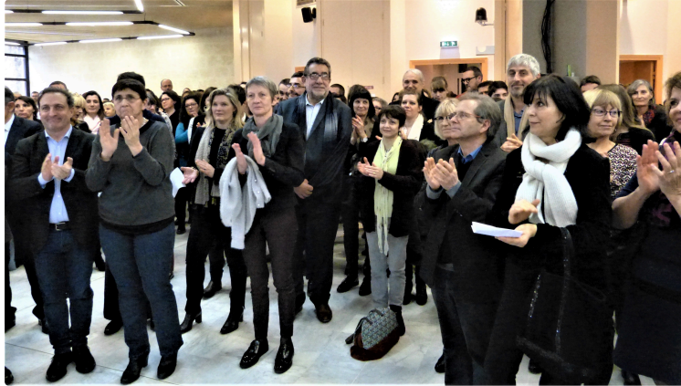
Conseil Départemental : meilleurs vœux 2019