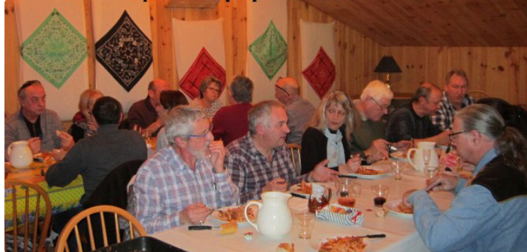
Country : Le festival dévoile sa programmation