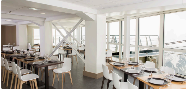
« Le 2 877 », la belle surprise du Pic du Midi

Ça vous dirait une marmite de lotte et crustacés au jus safrané ? Suivie d'une Pavlova aux fruits de saison. Hummm ! Et un pavé de cerf des Hautes-Pyrénées aux poires pochées au Madiran, avec Ronde du berger Ossau Iraty et vache au lait cru pour finir ?... Ne dites rien, vos papilles en fondent déjà.