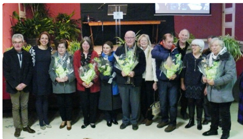
Les lauréats du concours local des maisons fleuries.