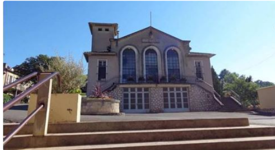
Vœux de la municipalité

De gros chantiers en perspective pour 2019