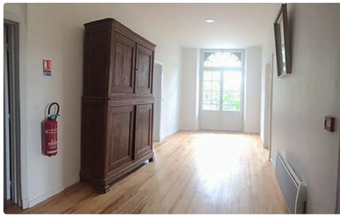
La salle d'accueil