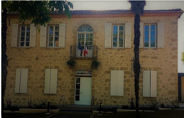
Un beau défi de la ruralité

Il est des villages qui se meurent, et qui regardent en soupirant le temps faire des ravages sur leur patrimoine. Et puis ceux qui se grattent la tête autour d'une table et qui décident de prendre les choses en main.