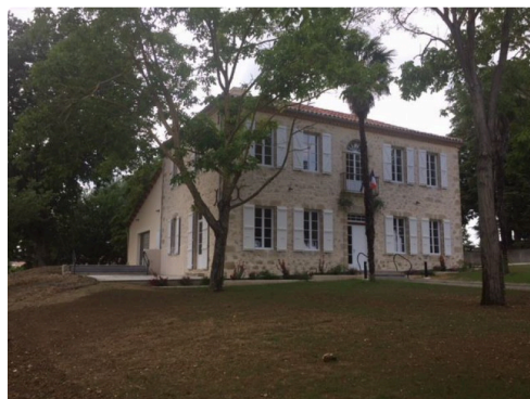
Terrasse idyllique pour les beaux jours