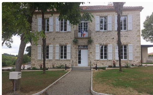
La bâtisse rénovée

Ou 06 18 65 57 66 – Site Internet : https://www.mairie-preneron.com