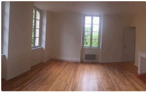
Un bureau prêt à louer