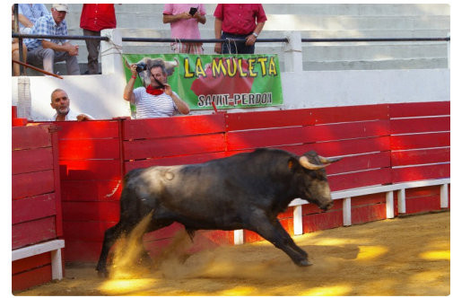
Beaucoup d'envie d'en découdre des la sortie de ce Turkey