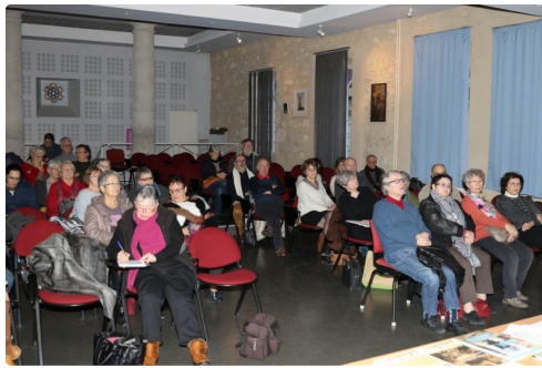
Le public attentionné de cette conférence.