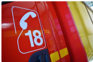
Faits Divers : carambolage sur la RN21

PAVIE - Un carambolage sur la RN21 a fortement perturbé la circulation qui, un moment, a dû être totalement fermée dans les deux sens vers 19 h 30. Trois véhicules impliqués dans cet accident qui a fait trois blessés sans gravité transportés sur l'hôpital d'Auch par les sapeurs-pompiers de Pavie, Auch et Montesquiou. Il s'agit de deux hommes 50 et 70 ans et une femme de 72 ans. Sur place, la gendarmerie a établi les constatations d'usage. Deux véhicules se seraient accrochés en se croisant un troisième venant les percuter aucun blessé dans ce dernier véhicule.