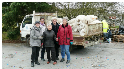
L'équipe féminine d'Auch qui se charge du rangement des sacs.