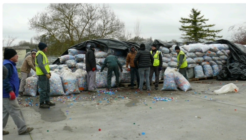
Stock de bouchons qui seront dans le camion.