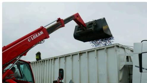
Le 8 janvier, 60 m3 soit 9 tonnes de bouchons iront en Belgique pour être recyclés en palettes.