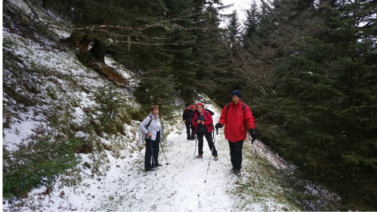
Première sortie hivernale

La sortie prévue le dimanche 13 janvier 2019, à cause de la météo incertaine, a finalement été maintenue. Bonne idée car le soleil était au rendez-vous dans la vallée de Campan.