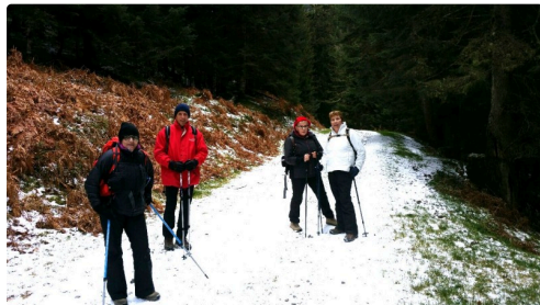
Payolle 2019 (1).jpg

Le prochain rendez-vous, pour la sortie de Gavarnie, est fixé au dimanche 10 février, en raquettes, en espérant d'ici là que la neige sera tombée en abondance.