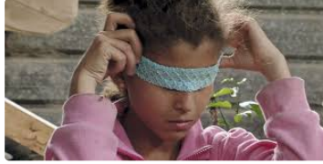
Festival Cinéma et Droits de l'Homme

Sensibiliser le public sur les droits humains