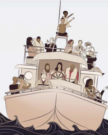
Illustration: M. B. / M. B.

CAHORS | CARCASSONNE | COLOMIERS | LABROGUIÈRE | LAVELANET | L'ISLE-JOURDAIN L'UNION | SAINT-GIRONS | MURET | TARBES | TOULOUSE | TOURNEFEUILLE