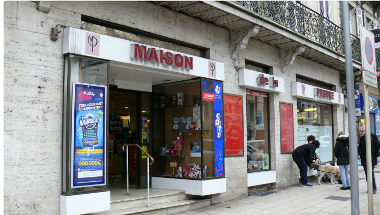
La Maison de la presse cambriolée et la Poste du Garros braquée