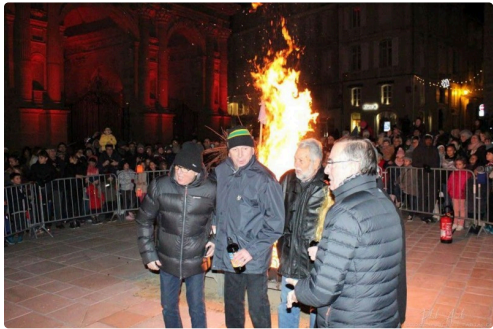
Ils ont entretenu le feu.