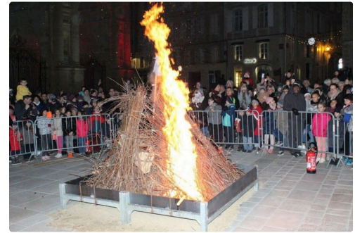
Le public admiratif devant le feu allumé sur le parvis de la cathédrale.