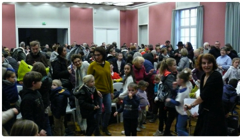
La salle des Cordeliers affichait complet avec enfants et parents.