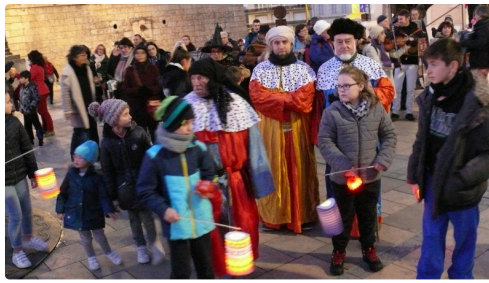
Les rois mages étaient accompagnés des enfants tenant des lampions.