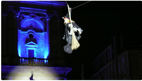
Magique descente de la Béfana du haut de la cathédrale.