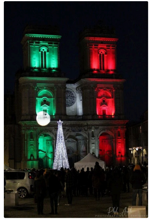
Magnifique jeux de lumières sur la cathédrale avec un final aux couleurs de l'Italie.