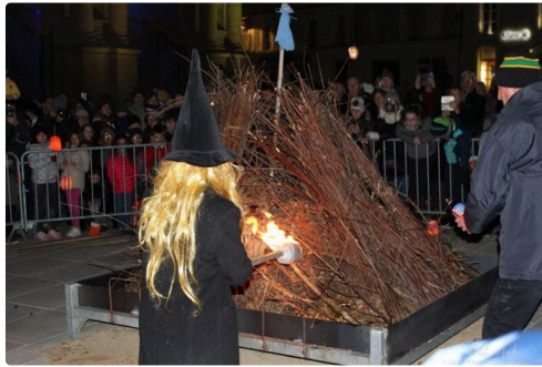
La Bafana allume le feu au « Pignarûl ».