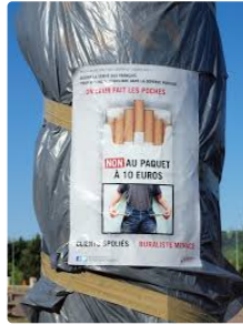
Vers la fin des radars fixes ?

De tous temps, quelques réfractaires à la limitation de vitesse ont rendu inopérants des radars fixes. Quelques manifestations - elles sont assez nombreuses et variées en France - se sont traduites aussi par des mises hors service avec ou sans dommages pour les appareils : bâchés, déguisés, recouverts de peinture, saccagés, incendiés. Le mouvement a pris une ampleur considérable avec les manifestations des Gilets Jaunes. Le fait de groupes déterminés ou de quelques quidams désœuvrés, les dommages sont plus graves et qui, cette fois encore, va payer la facture ? Le Gouvernement, c'est à dire vous et moi ! Tous ensemble ! tous ensemble !