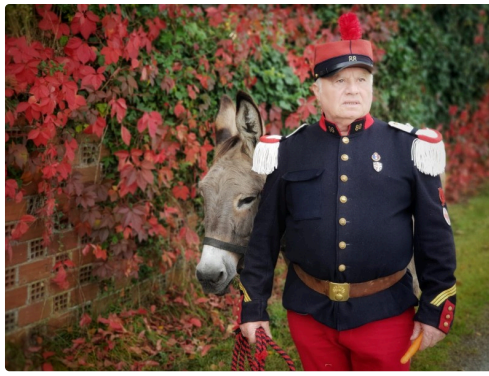
pour être fin prêt le moment venu.