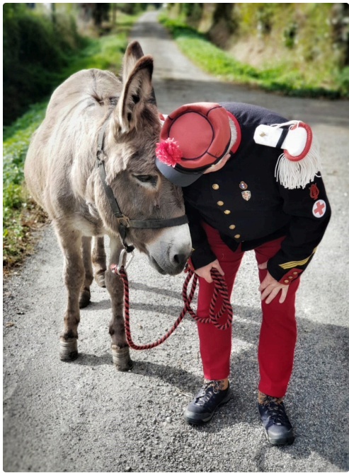
D'abord, faire connaissance...