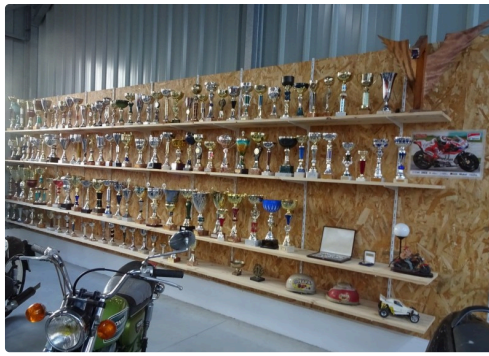
Un aperçu des trophées de la famille.