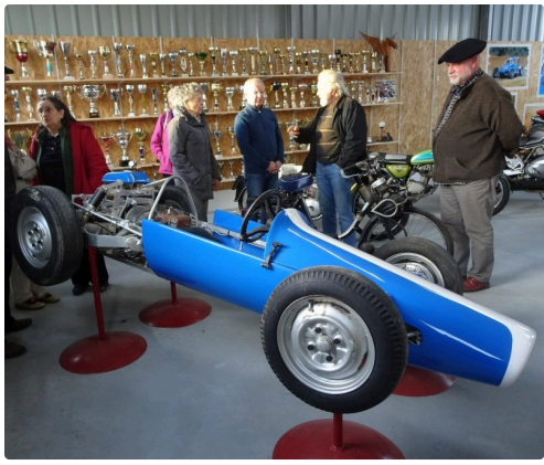
La voiture fabriquée spécialement pour son tout jeune fils.