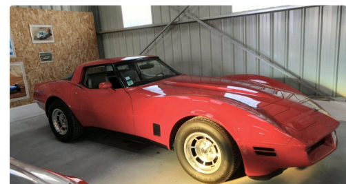
Une superbe corvette aussi.