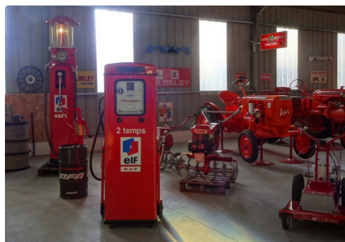
De superbes pompes à essence aussi.