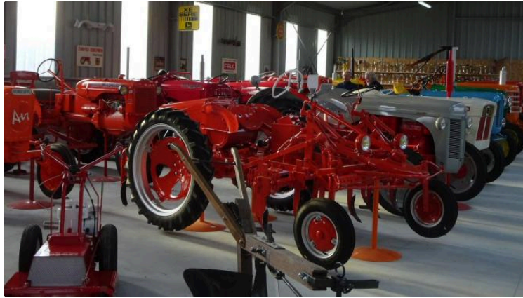
Un passionné de matériel agricole

Michel Dastugue a construit son musée pour abriter sa collection de tracteurs restaurés