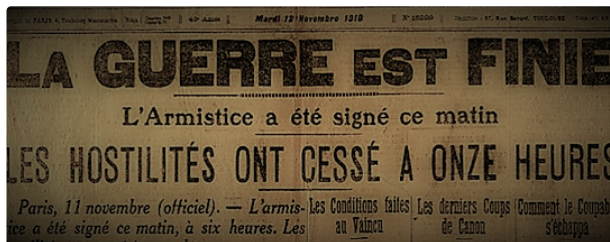
Il y a cent ans... 1918 : bilan de la dernière année de guerre

À l'occasion du centenaire de la Première guerre mondiale, la Société archéologique du Gers et les écrivains publics du Gers se sont associés pour vous faire découvrir la chronologie des événements marquants de la Grande Guerre, tels qu'ils ont été vécus par les Gersois, au travers des grandes batailles qui l'ont émaillée. Chacun d'eux sera l'occasion d'un article qui en reprendra les grandes lignes et s'appuiera sur des portraits d'hommes, soldats gersois, morts ou disparus. L'idée de cette série est de leur rendre hommage pour, qu'à travers eux, le sacrifice de tous ceux de 14 ne soit pas emporté par l'oubli, même cent ans après.