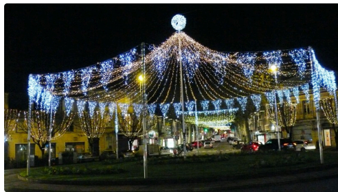
Le chapiteau place de Verdun.