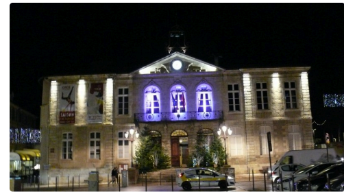
La mairie d'Auch.