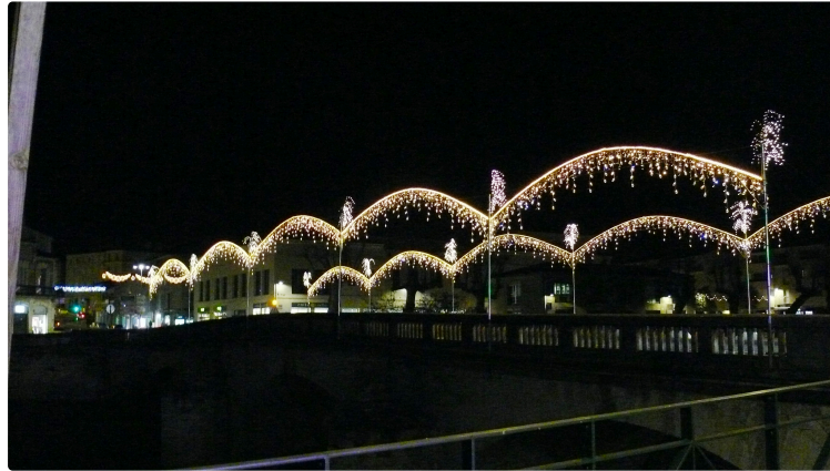
La ville brille de mille feux

Depuis le 1er décembre, les illuminations de Noël brillent sur la ville de mille feux, un spectacle à apprécier à la tombée de la nuit qui se prolongera jusqu'au 4 janvier. Une véritable prouesse réalisée par le service municipal « Fêtes et cérémonies » qui a installé 8,5 km de guirlandes illuminées toutes équipées de matériel LED. A voir l'illumination tout en sobriété du parvis de la cathédrale avec son immense sapin, le grand chapiteau installé sur le rond-point de la place de Verdun (La Patte d'Oie), le pont de la Treille et ses arches lumineuses, l'avenue Alsace et son plafond étoilé... Et bien d'autres rues qui vous surprendront par leurs « travers de rue » de 8 mètres comme l'avenue Hoche ou encore la rue Rouget de Lisle. Des féeries à consommer sans modération.