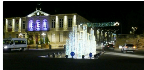
Le jet d'eau central, place de la Libération.