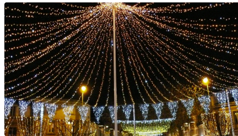
Un mat de 12 mètres de haut pour soutenir la structure.