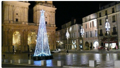
Le parvis de la cathédrale.

Depuis le 1er décembre, les illuminations de Noël brillent sur la ville de mille feux, un spectacle à apprécier à la tombée de la nuit qui se prolongera jusqu'au 4 janvier. Une véritable prouesse réalisée par le service municipal « Fêtes et cérémonies » qui a installé 8,5 km de guirlandes illuminées toutes équipées de matériel LED. A voir l'illumination tout en sobriété du parvis de la cathédrale avec son immense sapin, le grand chapiteau installé sur le rond-point de la place de Verdun (La Patte d'Oie), le pont de la Treille et ses arches lumineuses, l'avenue Alsace et son plafond étoilé... Et bien d'autres rues qui vous surprendront par leurs « travers de rue » de 8 mètres comme l'avenue Hoche ou encore la rue Rouget de Lisle. Des féeries à consommer sans modération.