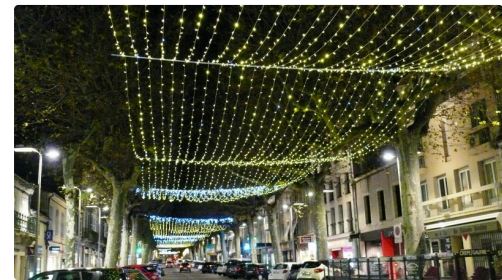
Plafond lumineux, avenue Alsace.