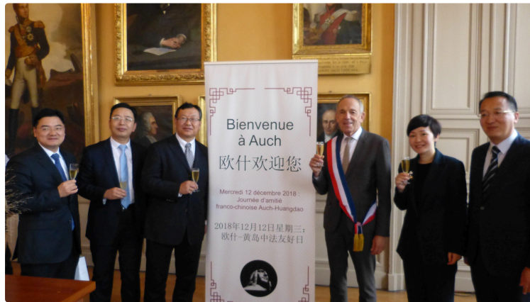
Auch et ses chinoiseries