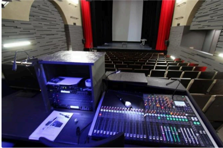
Désiré, d'après Sacha Guitry

Par la Compagnie de théâtre Grenier de Toulouse