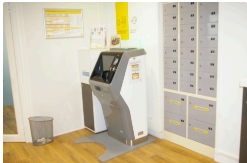
Un guichet libre-service pour timbres et divers affranchissements