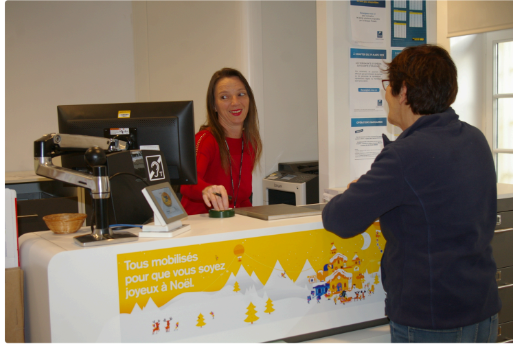
Le bureau de poste de Plaisance est ouvert à nouveau

Il était fermé pour rénovation pendant deux mois