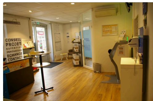
Un accueil plus agréable

Si la poste se décidait à installer en plus un guichet libre-service, le bonheur serait total. On peut toujours rêver.