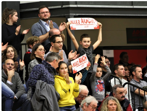
Des supporters heureux.