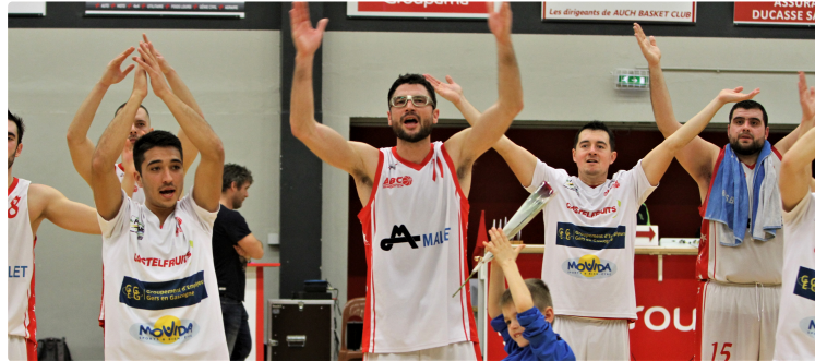
Basket NM3 : Auch seul leader

Les Auscitains au terme d'une rencontre dense parviennent à s'imposer dans la dernière minute de jeu