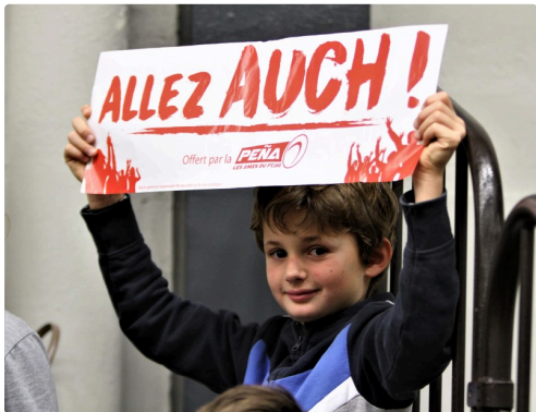
Un jeune supporter auscitain.