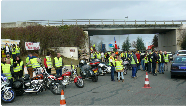
Les Gilets jaunes auscitains ont assuré avec maîtrise leur manifestation

Présents aux quatre coins de la ville, les Gilets jaunes ont su faire passer leurs messages