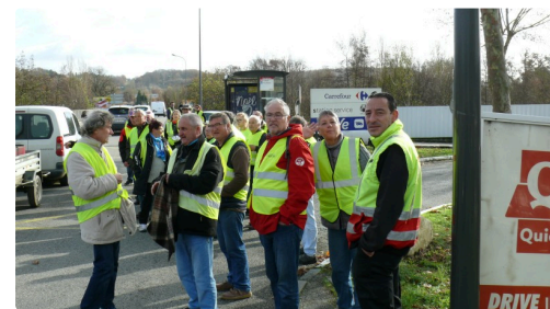
Blocage de l'entrée du centre commercial Carrefour.