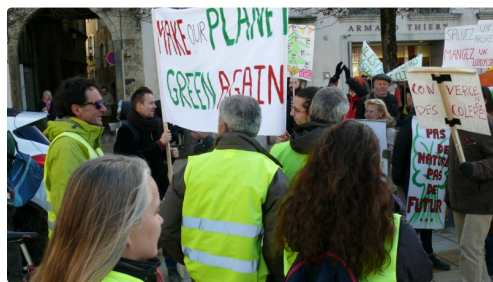
Rencontre place de la Libération entre Gilets jaunes et marcheurs pour le climat.

Alors que certains retournaient au rond-point des Justes pour se retrouver autour des barbecues, d'autres quittaient le lieu pour aller ici et là « au feeling comme le dit un Gilet jaune » vers les ronds-points et en ville. Une technique de manifestation pacifique qui, sans bruit, s'avère efficace pour créer des ralentissements.