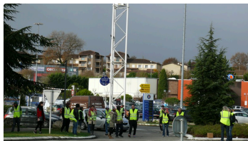
Filtrage au rond-point de Leclerc.