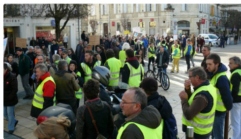
Gilets Jaunes et marcheurs pour le climat sur la place de la Libération.