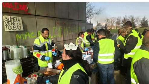
intendance assurée