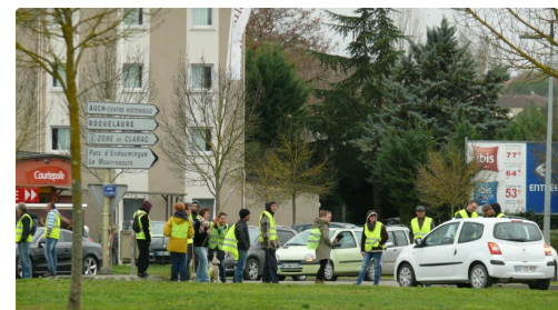
Filtrage au rond-point des Justes.