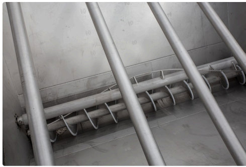
Le raisin arrive là