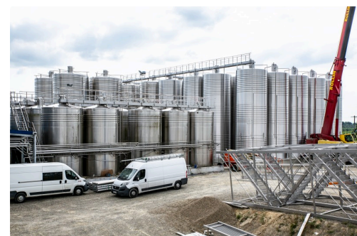
Les nouvelles cuves, à droite