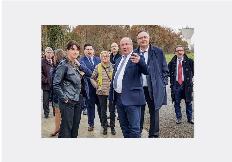
Inauguration des nouvelles installations à la Cave de Nogaro

Avec la préfète et de nombreux officiels