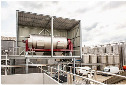
Un nouveau pressoir