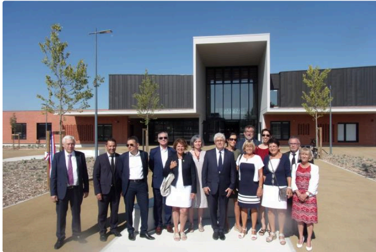
Les femmes à l'honneur dans les établissements scolaires gersois

Quatre collèges vont célébrer des personnalités féminines