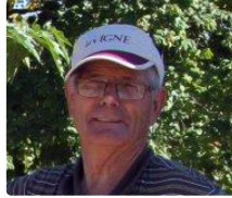
Homicide par arme à feu

André Dauzère de Mouchan abattu devant son domicile