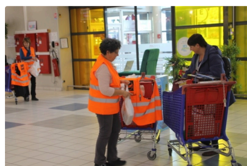
A Carrefour Auch