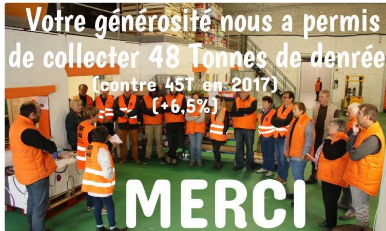
Collecte de la Banque Alimentaire « Un petit exploit dans le contexte ! »

"Avec 48 tonnes de denrées récoltées, je vous confirme une progression de notre collecte de 6,5 % par rapport à 2017. Nous sommes particulièrement heureux de ce résultat dans le contexte que vous connaissez".