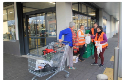
A Lidl Auch