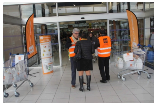
Au Centre Leclerc Auch

Merci pour ces belles rencontres et ces réactions très positives qui nous motivent toujours plus et merci pour tous ceux qui vont bénéficier de vos dons. Merci également à tous les médias qui avez magnifiquement bien relayé notre action ».