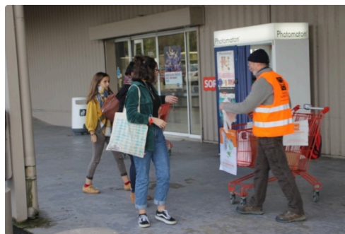
A Intermarché Auch