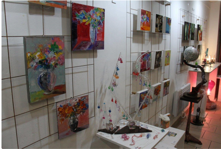
Les Petits formats , idées de cadeaux à la Galerie de Jad