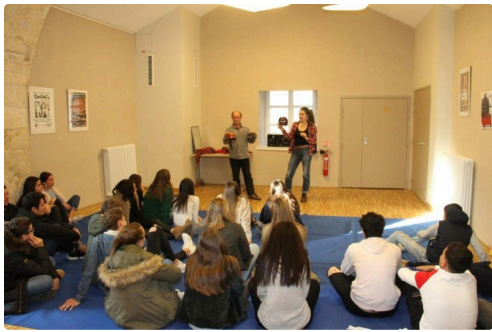
Boite à jouer.jpg