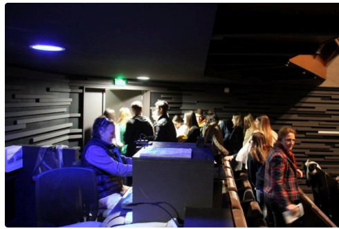
Boite à jouer 2.jpg