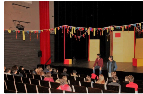
Boite à jouer 3.jpg