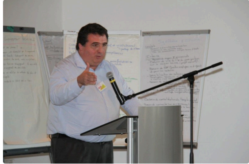
Intervention du maire de Saint-Clar, David Taupiac.