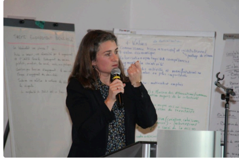
Intervention de la sous-préfète, Isabelle Sandrané.