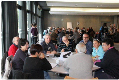
Des tables rondes très studieuses.