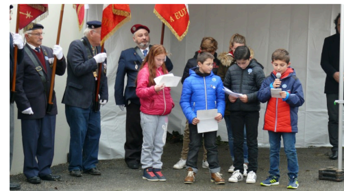
Les jeunes pousses du RCA ont fait l'appel des 55 noms.