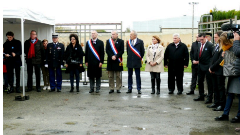
Les autorités avant la cérémonie.

CLIC ICI pour accéder à l'article de présentation.