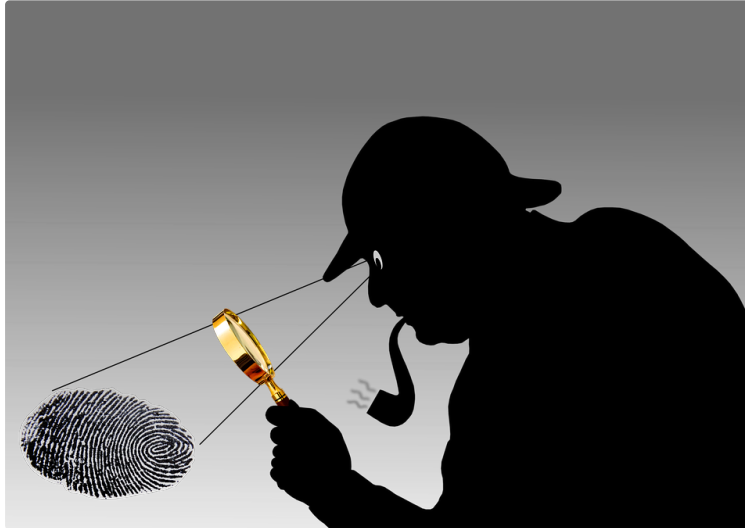
Festival du Polar d'Auch

40 auteurs de polars réunis aux Cordeliers