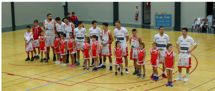
Basket championnat de France : La mauvaise affaire d'Auch, Valence-Condom trop inconstant au Val d'Albret

Gimont maintien le cap, Eauze s'écroule en Chalosse