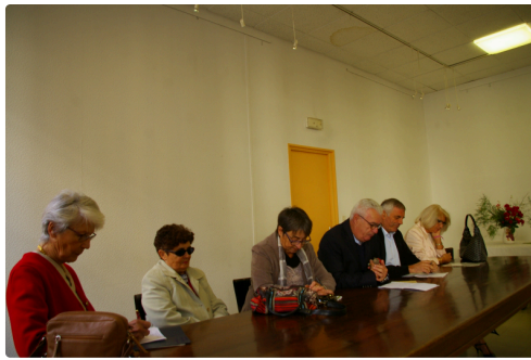
Bureau et élus lors de l'assemblée générale