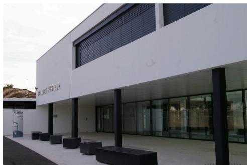
Le Collège Pasteur aujourd'hui