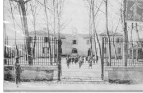
Anciens du Cours Complémentaire en assemblée générale