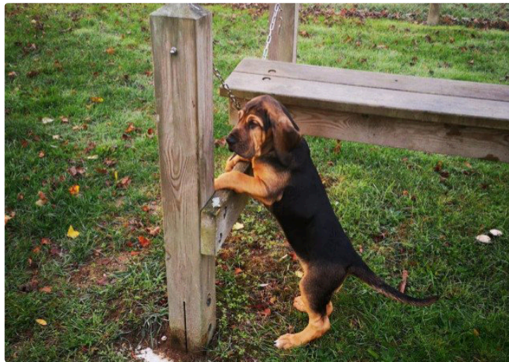
Crokdur un avenir tout tracé

Ce tout jeune chiot a déjà intégré les forces de la gendarmerie