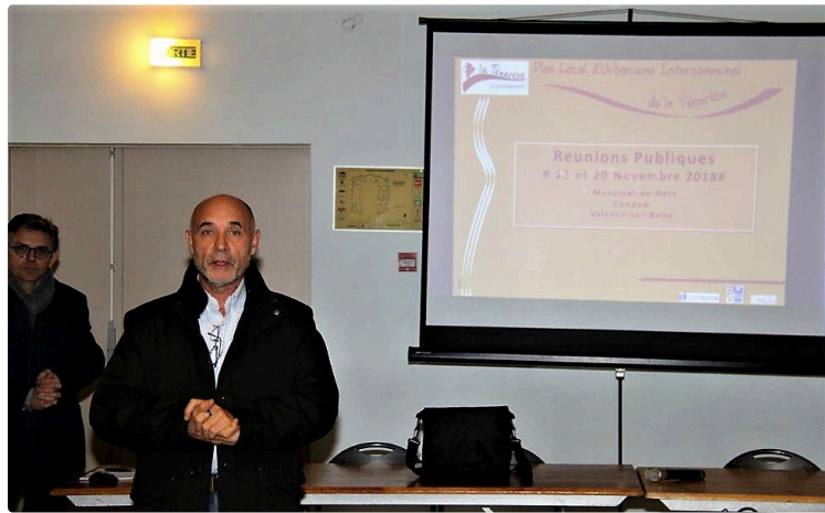
Le PLUI a été présenté

Le PLUI (plan local d'urbanisme intercommunal) nouvelle version a été présenté le mardi 20 novembre 2018, à Condom, devant un public clairsemé. La présentation des différentes règles régissant la mise en place de ce nouveau PLUI a été réalisée par le représentant du Cabinet Citadia. Ce cabinet a été chargé de l'étude qui a duré quatre ans.