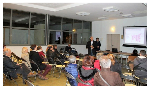
Un public clairsemé