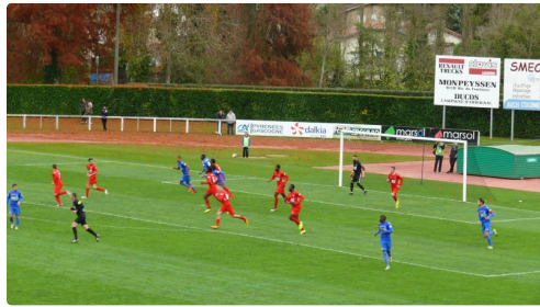
Auch repart à l'attaque.