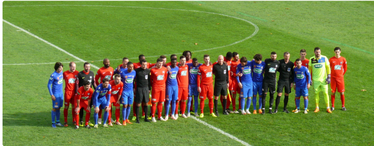
Football 7ème tour de la Coupe de France : Le Gazélec d'Ajaccio brise le rêve des Auscitains

Auch a tenu la dragée haute aux Corses peu convaincants