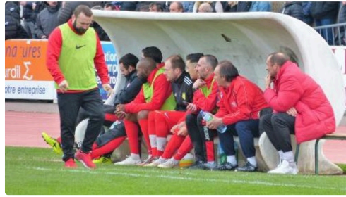
Le banc auscitain.