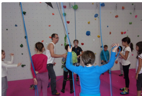
Le mur et ses utilisateurs