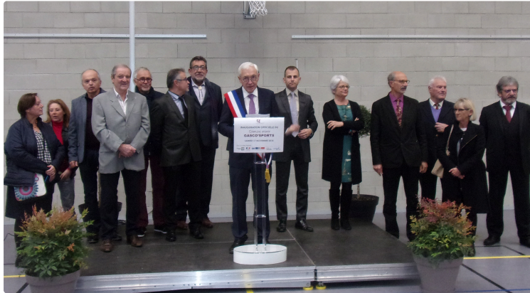
Gasco'Sports : nouveau complexe sportif

Inauguration du troisième gymnase de l'Isle-Jourdain