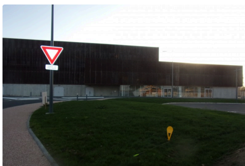
Le gymnase inauguré