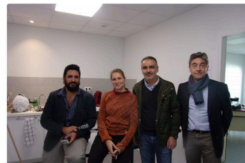
2 des Adjointes de L'Isle-Jourdain, responsable de Radio fil de l'eau, l'animatrice de l'OIS