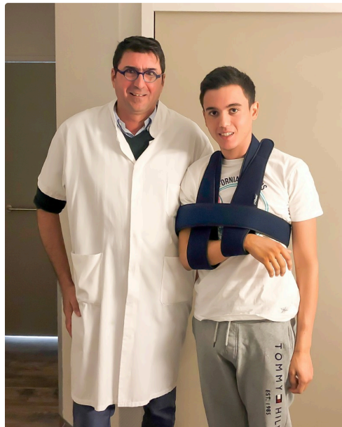
Le matador et son chirurgien