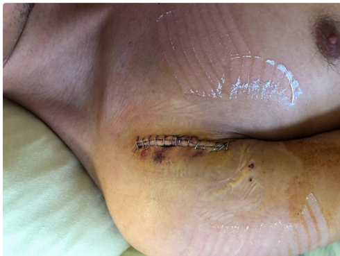
Cicatrice de l'opération

N.B. Données communiquées par Gérard Ducès (y compris la photo du haut de page).