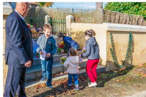
Les enfants déposent des fleurs au monument aux morts

N.B. - Les données ont été fournies par Simone Ducéré.