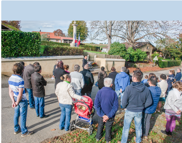
On n'oublie pas les poilus à Arblade-le-Haut non plus

Les élèves de l'école redonnent vie à un soldat