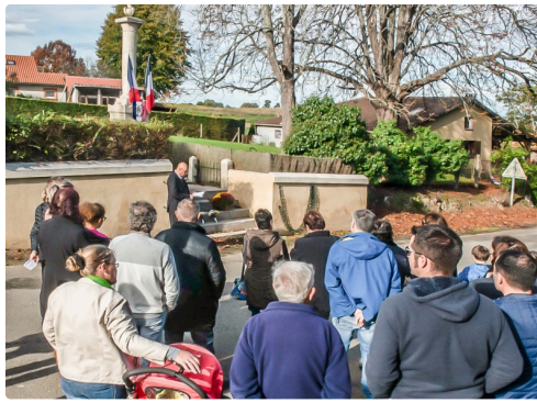
Le maire parle