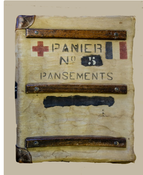
Panier de pansements