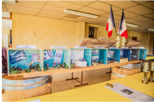
Scènes de guerre