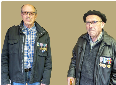
Anciens combattants de la guerre d'Algérie