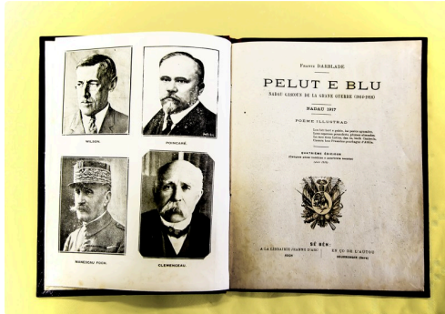
Ouvrage en occitan sur la guerre de 1914-1918