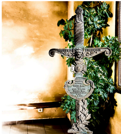
En mémoire des frères Dassion