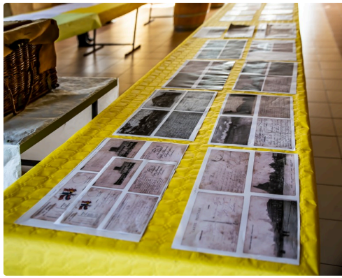
Alignement de documents souvenirs