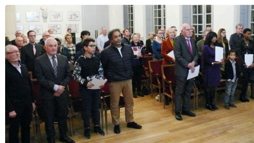
La cérémonie s'est conclue par le chant de l'hymne national, la Marseillaise.