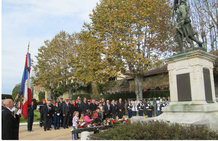
11 novembre cérémonie particulièrement bien suivie dans la sous préfecture