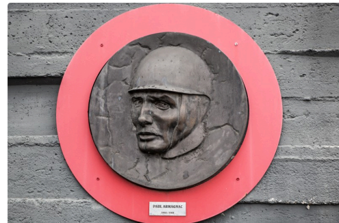
Le relief de Paul Armagnac sur le mur des bureaux du circuit