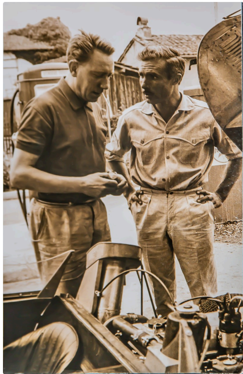
Paul Armagnac